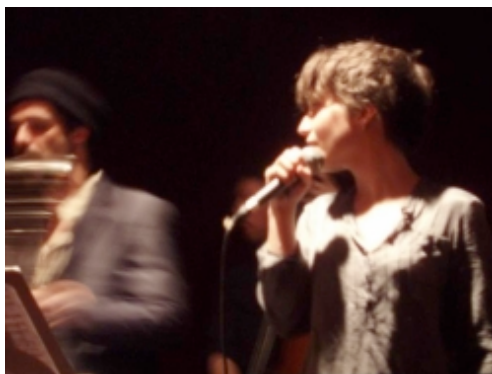
Jeanne Added

seul vocabulaire... Je l'imaginai grande, mince, plutôt pâle, presque absente, comme les sirènes ou les fantômes qu'on croise dans les livres de contes. Voilà pourquoi en écoutant Jeanne Added dans Cubique je me sens en territoire familier, et c'est plutôt agréable. Comme Elise Caron dans l'ONJ, Jeanne Added a choisi de se passer des mots, comme un pied de nez à toutes ces chanteuses qui n'ont rien à dire, mais le disent quand même. Et puisqu'elle utilise sa voix comme un instrument, Jeanne Added peut s'insinuer dans la musique sans jamais la dépasser, participant au même titre qu'un saxophone ou une guitare, aux jolis effets orchestrés par Pierre De Bethmann .